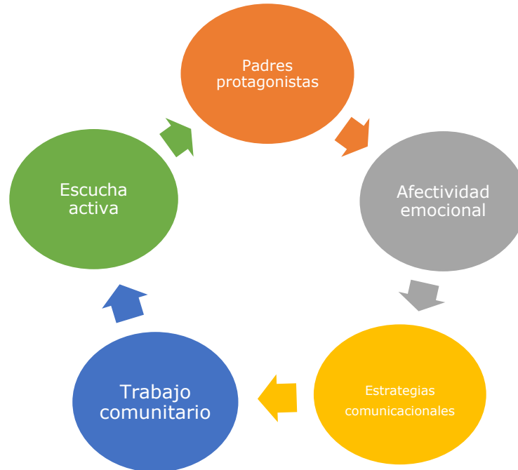
FIGURA 2. PROGRAMA DE EDUCACIÓN SEXUAL OBLIGATORIA PARA PADRES (PESOP).