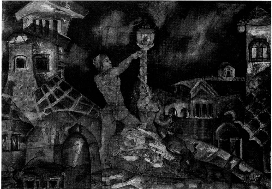
El perro ladra (2005) Óleo sobre tela, 91 x 61 cm