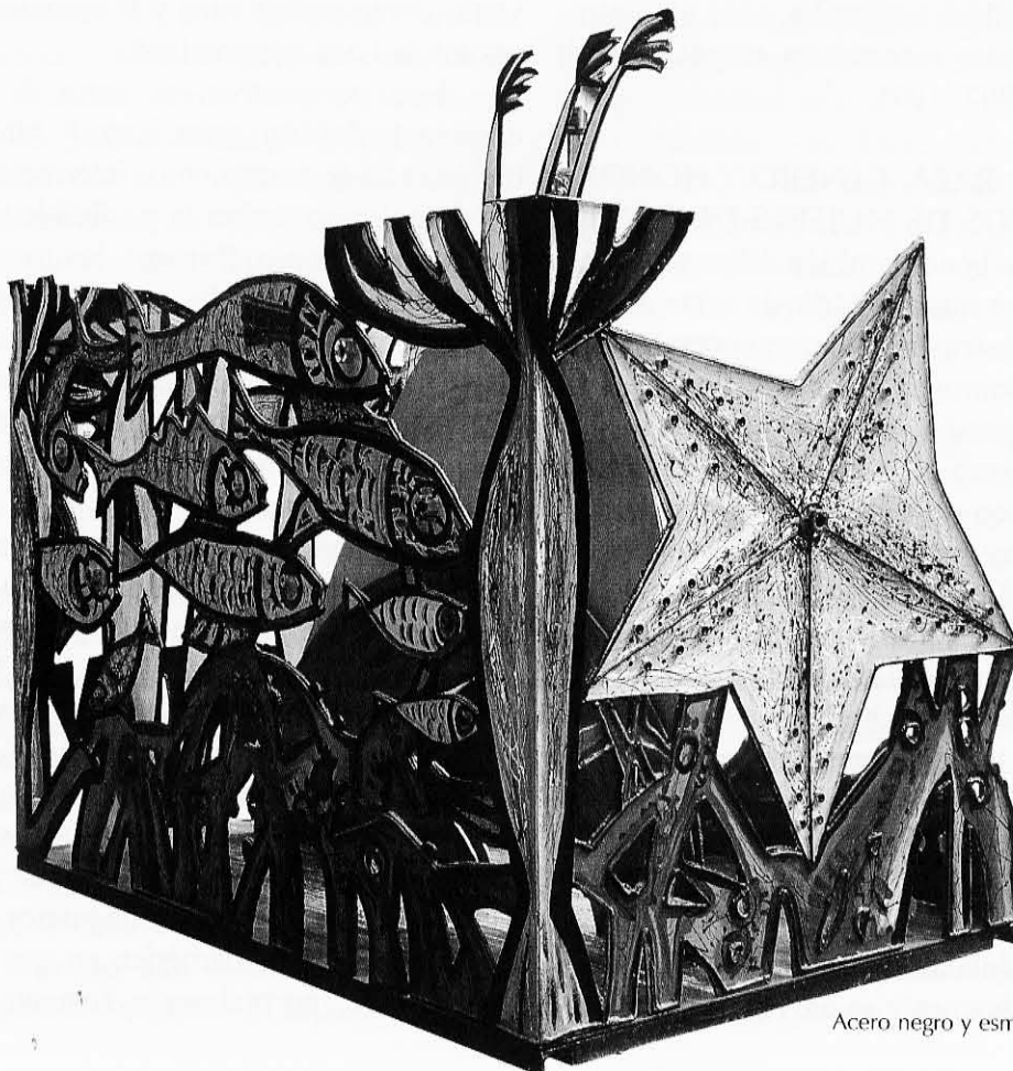
La pecera tropical (2007) Acero negro y esmalte, 150 x 220 x 140 cm

Como la institución del matrimonio estaba reservada para personas «iguales», los hombres blancos no podían casarse con mujeres de color «racialmente inferiores». Sin embargo, estas rela-