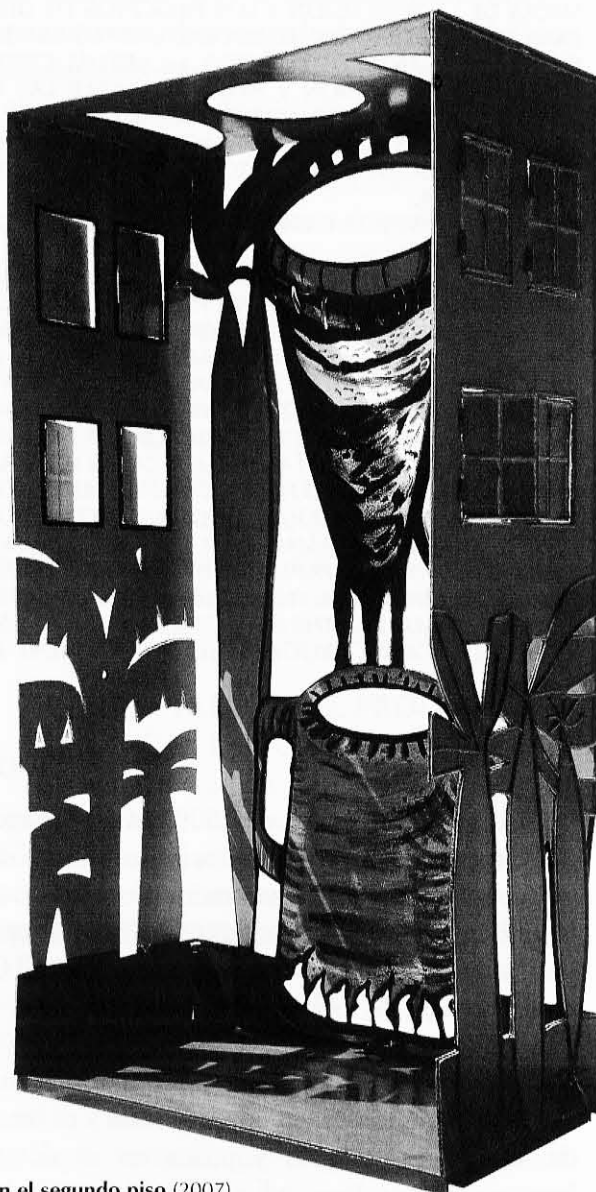
(Derecha) Colada en el segundo piso (2007) Acero negro y esmalte, 280 x 150 x 80 cm