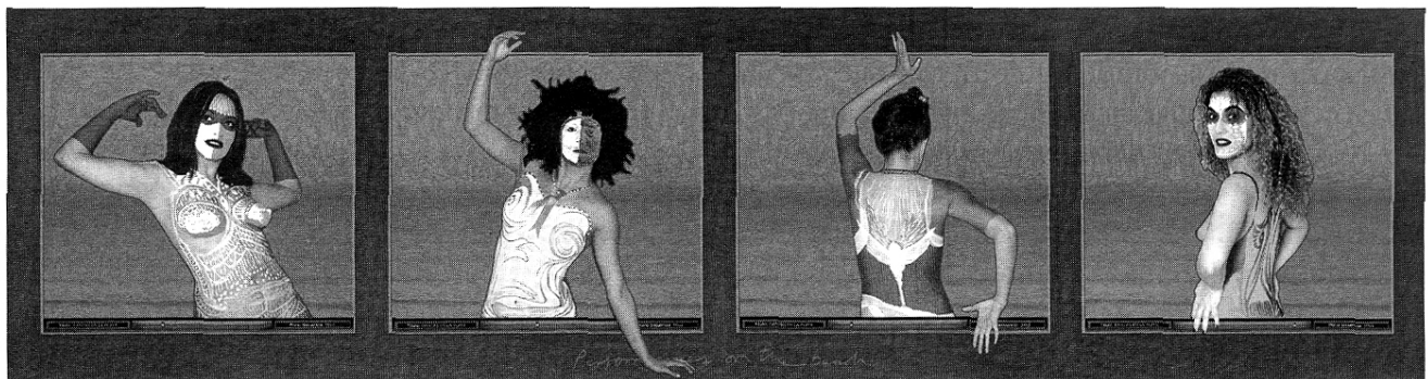
Performances on the beach (tríptico, 2003).